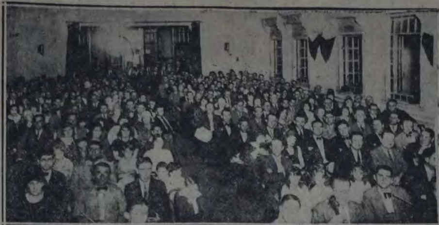
ASPECTO QUE PRESENTABA A EL SALON DE LA CASA DEL PUEBLO DURANTE EL festival de anoche en honor de los delegados bonaerenses

Suministro de energía eléctrica Ramírez — Refiere algunos de los más graves aspectos que reviste el suministro de energía eléctrica por parte